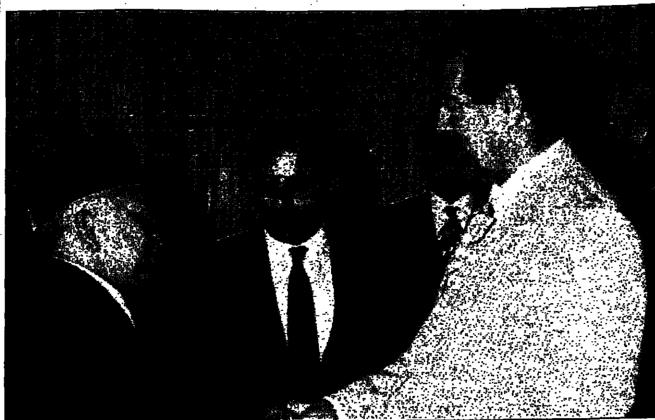
الرئيس العراقي صدام حسين يستقبل مبعوث الرئيس الامريكسي يوسف حبيبي في بغداد امس